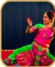
ಕು|| ನಿಶ್ಚಿತ ನಟ, ಭರತನಾಟ್ಯ ಕಲಾವಿದರು