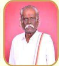
ಪದ್ಮಶ್ರೀ ನಾಡೋಬ ಡಾ. ಮುನಿವೆಂಕಟಪ್ಪ ಖ್ಯಾತ ಕವನ ಕಲಾವಿದರು

ದಿನಾಂಕ : 29-12-2023, ಶುಕ್ರವಾರ ಬೆಳಿಗ್ಗೆ 10.00 ಗಂಟೆಗೆ | ಸ್ಥಳ : ಬಿ.ಜಿ.ಎಸ್. ಸಭಾಂಗಣ, ಎಸ್‌ಜೆ‌ಸಿ‌ವಿಟಿ