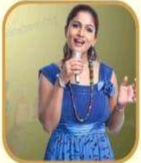
ಡಾ|| ಶಮಿತಾ ಮಲ್ಲಾಡ್ ಖ್ಯಾತ ಚಲನಚಿತ್ರ ಗಾಯಕರು