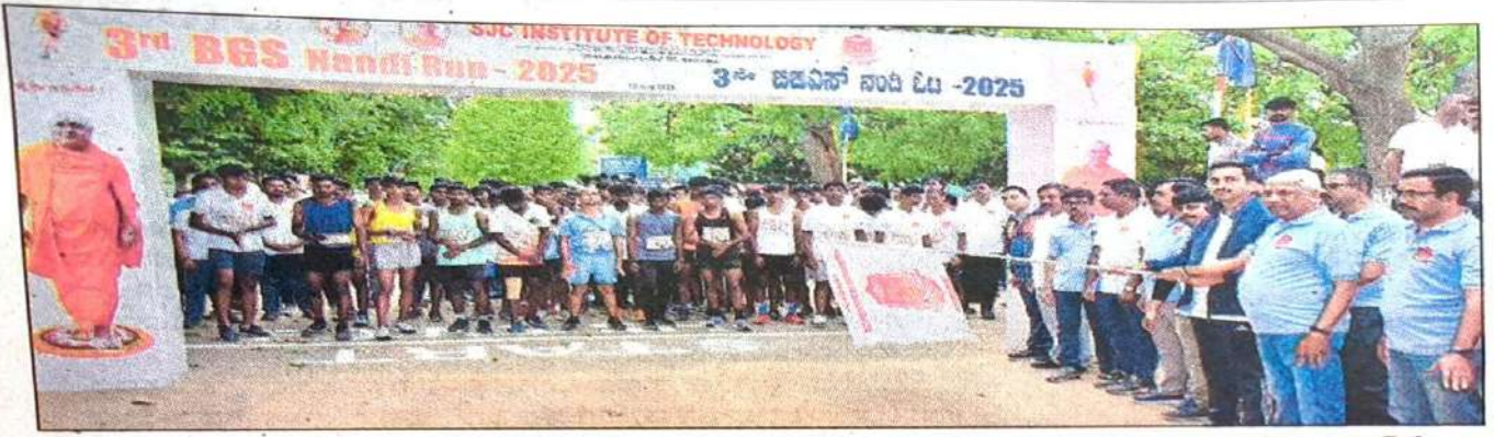
ಚಿಕ್ಕಬಳ್ಳಾಪುರದ ಎಸ್‌ಜೆಸಿಐಟಿ ಕಾಲೇಜಿನಲ್ಲಿ ಆಯೋಜಿಸಲಾಗಿದ್ದ ಬಿಜಿಎಸ್ ನಂದಿ ಓಟದ ಸ್ಪರ್ಧೆಗೆ ಎಸ್‌ಪಿ ಕುಶಲ್ ಚೌಕ್ ಚಾಲನೆ ನೀಡಿದರು