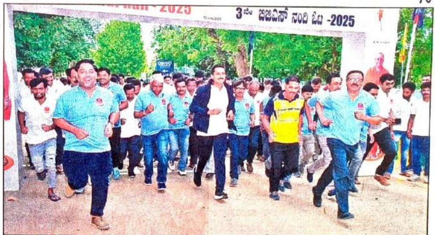
ಚಿಕ್ಕಬಳ್ಳಾಪುರ ಹೊರವಲಯದ ಎಸ್‌ಜೆಸಿಐಟಿಯಲ್ಲಿ ಶನಿವಾರ ಬಿಜಿಎಸ್ ನಂದಿ ಓಟ-2025ಕ್ಕೆ ಜಿಲ್ಲಾ ಪೊಲೀಸ್ ವರಿಷ್ಠಾಧಿಕಾರಿ ಕುಶಲ್ ಚೌಕ್ ಚಾಲನೆ ನೀಡಿ, ಓಟದಲ್ಲಿ ಪಾಲ್ಗೊಂಡರು.

ಎಸ್‌ಜೆಸಿಐಟಿ ಪ್ರಿನ್ಸಿಪಾಲ್ ಡಾ.ಜಿ.ಟಿ.ರಾಜು ಮಾತನಾಡಿ, ಸ್ವಾಮೀಜಿಯವರ ಆಶೀರ್ವಾದದಿಂದ ಎಸ್‌ಜೆಸಿಐಟಿಯಲ್ಲಿ ಕಳೆದ 38 ವರ್ಷಗಳಿಂದ ಸಾವಿರಾರು ಎಂಜಿನಿಯರಿಂಗ್ ವಿದ್ಯಾರ್ಥಿಗಳನ್ನು ರೂಪಿಸಿದೆ. 64 ಎಕರೆ ಸುಸಜ್ಜಿತವಾದ ಆವರಣವನ್ನು ನಮ್ಮ ಕಾಲೇಜು ಹೊಂದಿದೆ. ಆರೋಗ್ಯದ ಓಟದಲ್ಲಿ ವಿದ್ಯಾರ್ಥಿಗಳು, ಸಿಬ್ಬಂದಿ ವರ್ಗ ಸೇರಿದಂತೆ ಸುಮಾರು 1000ಕ್ಕೂ ಹೆಚ್ಚು ಸ್ಪರ್ಧಿಗಳು ಓಟದಲ್ಲಿ ಉನ್ನತಿಯಿಂದ ಭಾಗವಹಿಸಿದ್ದಾರೆ.