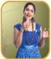
ಡಾ|| ಶಮಿತಾ ಮಲ್ಲಾಡ್ ಖ್ಯಾತ ಚಲನಚಿತ್ರ ಗಾಯಕರು