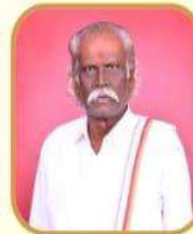
ಪದ್ಮಶ್ರೀ ನಾಡೋಬ ಡಾ. ಮುನಿವೆಂಕಟಪ್ಪ ಖ್ಯಾತ ಕವನ ಕಲಾವಿದರು

ದಿನಾಂಕ : 29-12-2023, ಶುಕ್ರವಾರ ಬೆಳಿಗ್ಗೆ 10.00 ಗಂಟೆಗೆ | ಸ್ಥಳ : ಬಿ.ಜಿ.ಎಸ್. ಸಭಾಂಗಣ, ಎಸ್‌ಜೆ‌ಸಿ‌ವಿಟಿ